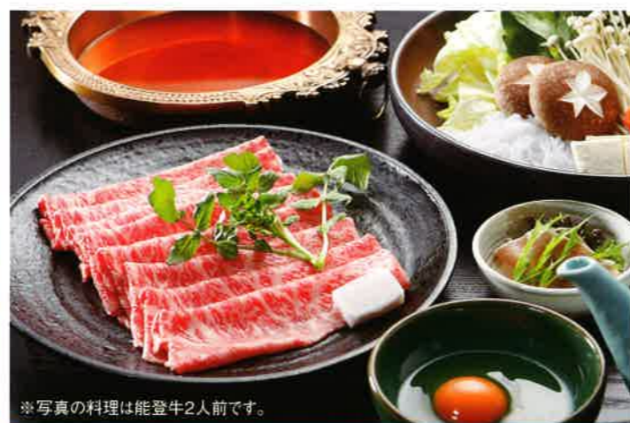
※写真の料理は能登牛2人前です。