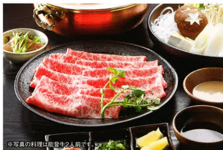
※写真の料理は能登牛2人前です。