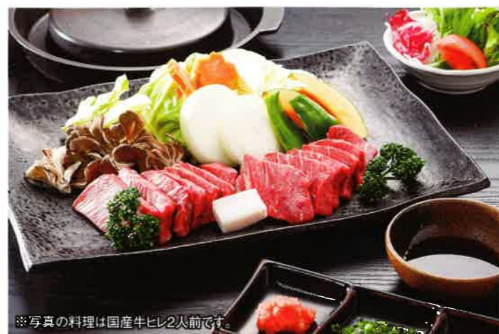
※写真の料理は国産牛ヒレ2人前です。