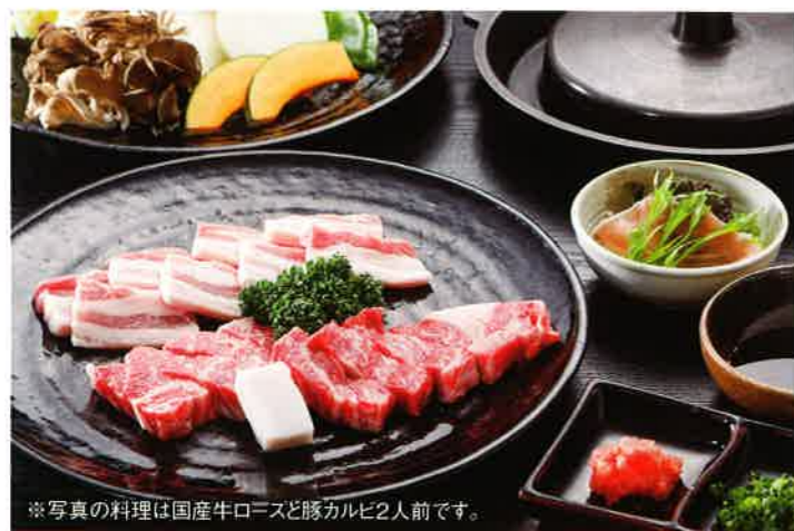
※写真の料理は国産牛ロースと豚カルビ2人前です。