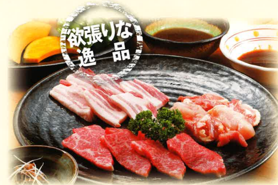
※写真の料理は2人前です。

※季節により盛り合せなどを変更する場合がございます。 ※能登牛は数に限りがございます。品切れの際はご了承ください。